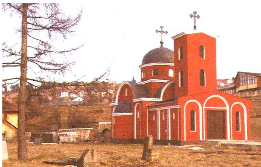
Foto 7. Crkva Sveti Jovan – Ružica u Rožajama, snimio: Ibro Skenderović

Crkva Ruža – Sveti Jovan nalazi se pored pravoslavnog groblja u južnom dijelu grada. Imala je širi značaj, što se može zaključiti po njenom položaju, veličini i freskama. Bila je sazidana od tesanog kamena i bigra (sige), dimenzija 5 x 12 m. Imala je oltar, srednji dio i pripratu. Obnovljena 1990. godine sredstvima ovdašnjih pravoslavaca i uz donaciju lokalne samouprave.