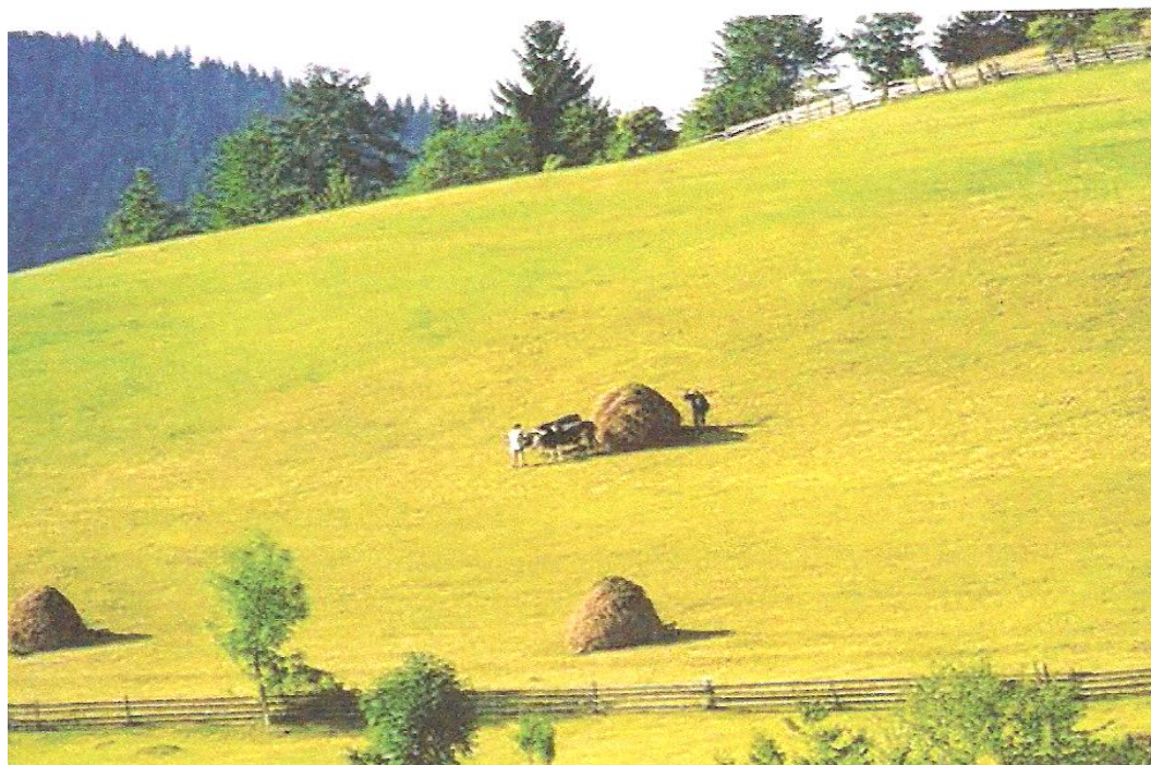
Foto 9. Ljetnji pejzaž u okolini Rožaja

Pejzažne odlike su važan elemenat turističke privlačnosti Rožajskog kraja. U kompoziciji ovdašnjeg pejzaža učestvuje više kategorija prostornih elemenata, što pejzaž čini ljepšim i atraktivnijim. Najvažniji prirodni elementi za oblikovanje fizionomije pejzaža svakako su reljef i vegetacioni dekor. Značajni su i uticaji klime i antropogenih faktora. Velika je razlika u izgledu pejzaža između kristalastih i krečnjačkih terena. Kristalasti tereni, sastavljeni od paleozojskih škriljaca, odlikuju se pretežno blagim oblicima reljefa i pitomim pejzažima sa bujnim šumsko-travnim kompleksima i obiljem tekućih voda. Oblici reljefa u krševitim zonama, glacijalni i kraški, imaju suprotne karakteristike. Oni su oštri i bez ili sa oskudnom vegetacijom i vodom. Posebnu karakteristiku predstavljaju duboko i strmo usječeni cirkovi, oštri vrhovi i kanjoni.