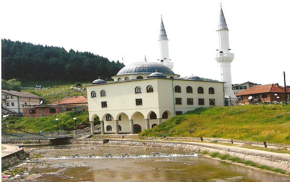
Foto 1. Gornja džamija (džamija sultana Murata II), snimio: Ibro Skenderović

Od sakralnih objekata najviše ima džamija. U Rožajama je podignuto pet džamije, a u svakom bošnjačko-muslimanskom selu ima po jedna, a u većim selima po dvije džamije. Ukupno u rožajskom kraju ima 26 džamija.