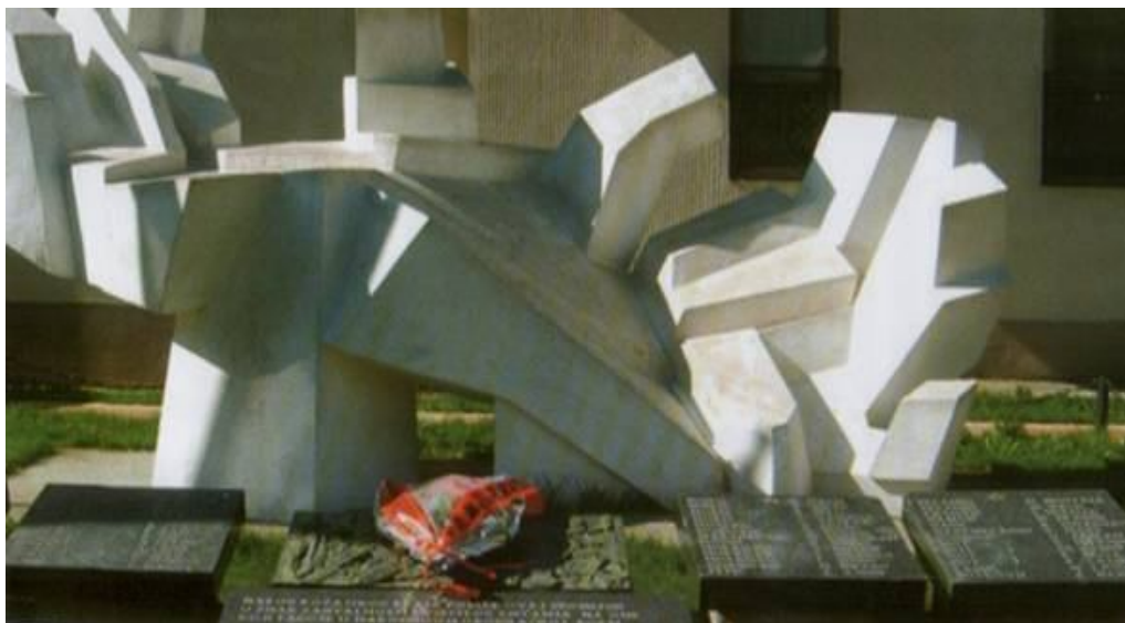
Foto 6. Spomenik palim borcima u toku rata 1941-1945