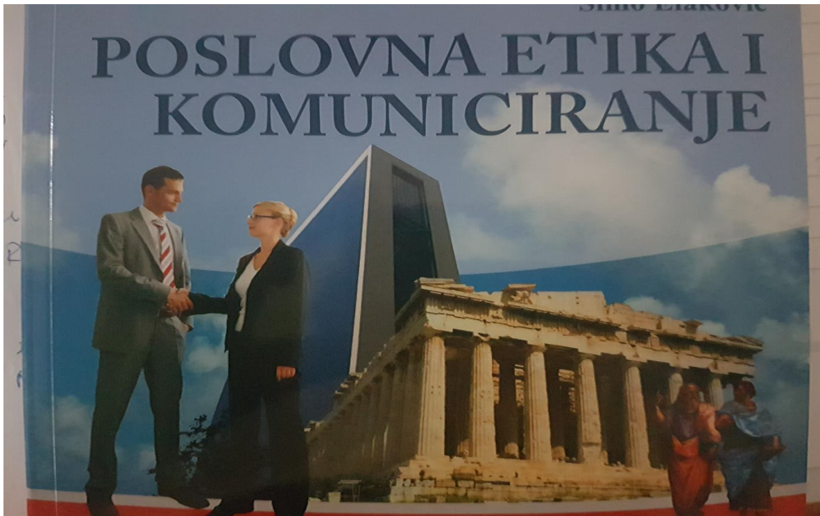
Slika 1.: Poslovna etika i komuniciranje 2

U donošenju etičkih odluka vrednosni stavovi menadžera imaju prevashodni značaj. Oni su naročito izraženi u slučajevima koji, niti su obuhvaćeni pisanim aktima, niti su se ranije pojavljivali u praksi.