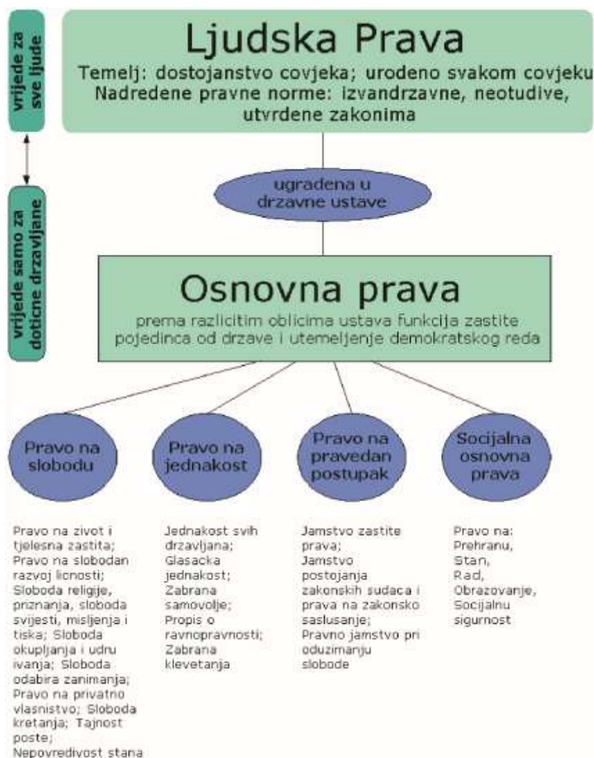
Dijagram 3: Pojašnjenje razlika između ljudskih i osnovnih prava 28

prava koja su sadržana u ustavima pojedinih država. Na temelju njih građanin se može obratiti sudu. Ljudska prava su u izvjesnoj mjeri osnovna ideja koja leži iza osnovnih prava. Do sredine 20. stoljeća njima se izražavao moralni zahtjev na prava definirana državnim redom. Dakle, ljudska prava su prirodna prava. "Općom poveljom o ljudskim pravima" Ujedinjenih naroda filozofska ideja se pokušava konkretizirati, a prava se pokušavaju smjestiti pod svjetska mjerila, kao što je to učinjeno s osnovnim pravima na nacionalnom, državnom nivou.