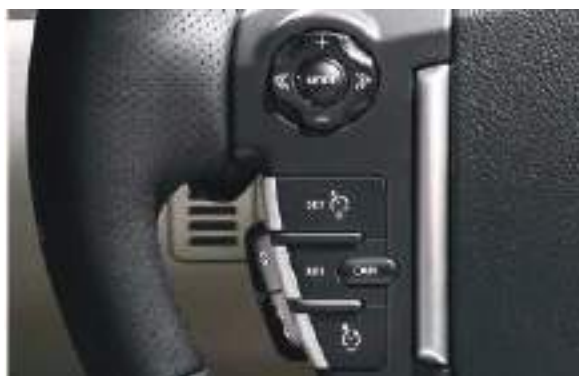
Slika 2. Dugmad na volanu za podešavanje