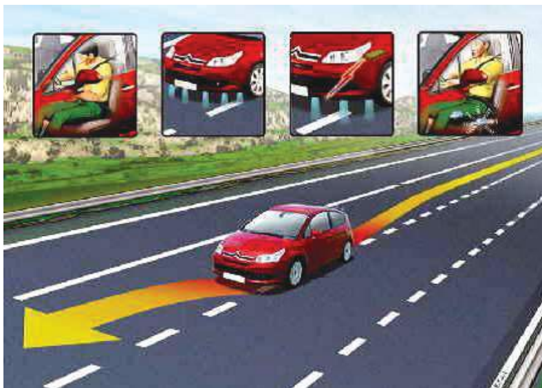
Slika 4. Šema rada LKAS sistema