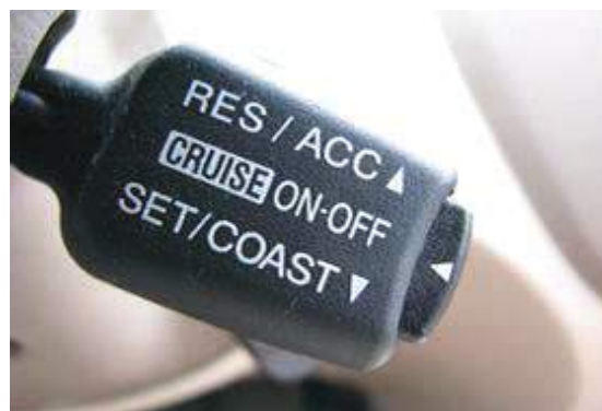
Slika 3. Podešavanje tempomata ručicom

Tempomat (CC – Cruise Control) uključuje se jednostavnim pritiskom komande na volanu i odabirom željene brzine (slika 2. i 3).