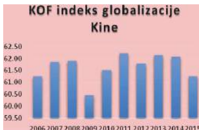
Grafik 3: Indeks globalizacije KOF za Kinu – KOFK u posmatranom razdoblju