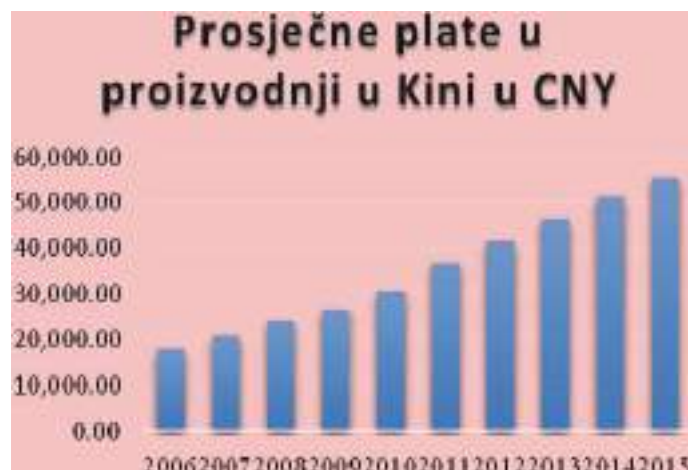
Grafik 1: Prosječna plata u proizvodnji u Kini u CYN – APWC u posmatranom razdoblju