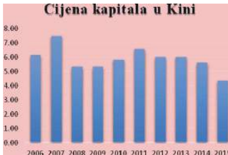
Grafik 2: Prosječna cijena kapitala u Kini u CYN – IRC u posmatranom periodu